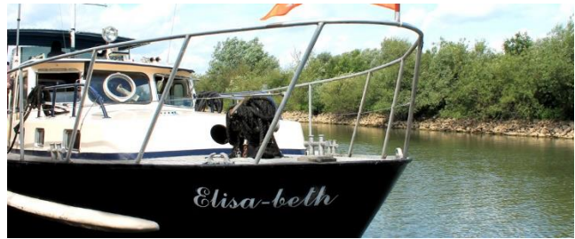
Opstappen aan de IJsselkade