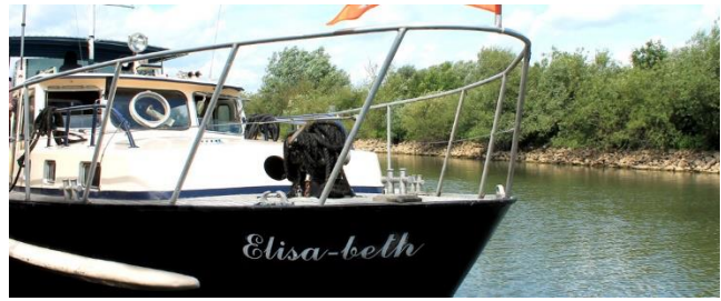
Opstappen aan de IJsselkade